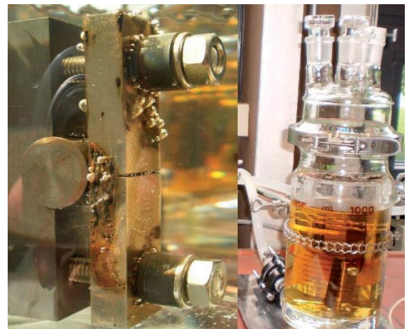
Rissinitiierungsversuch an einer gekerbten Biegeprobe unter Mediumsbedingungen